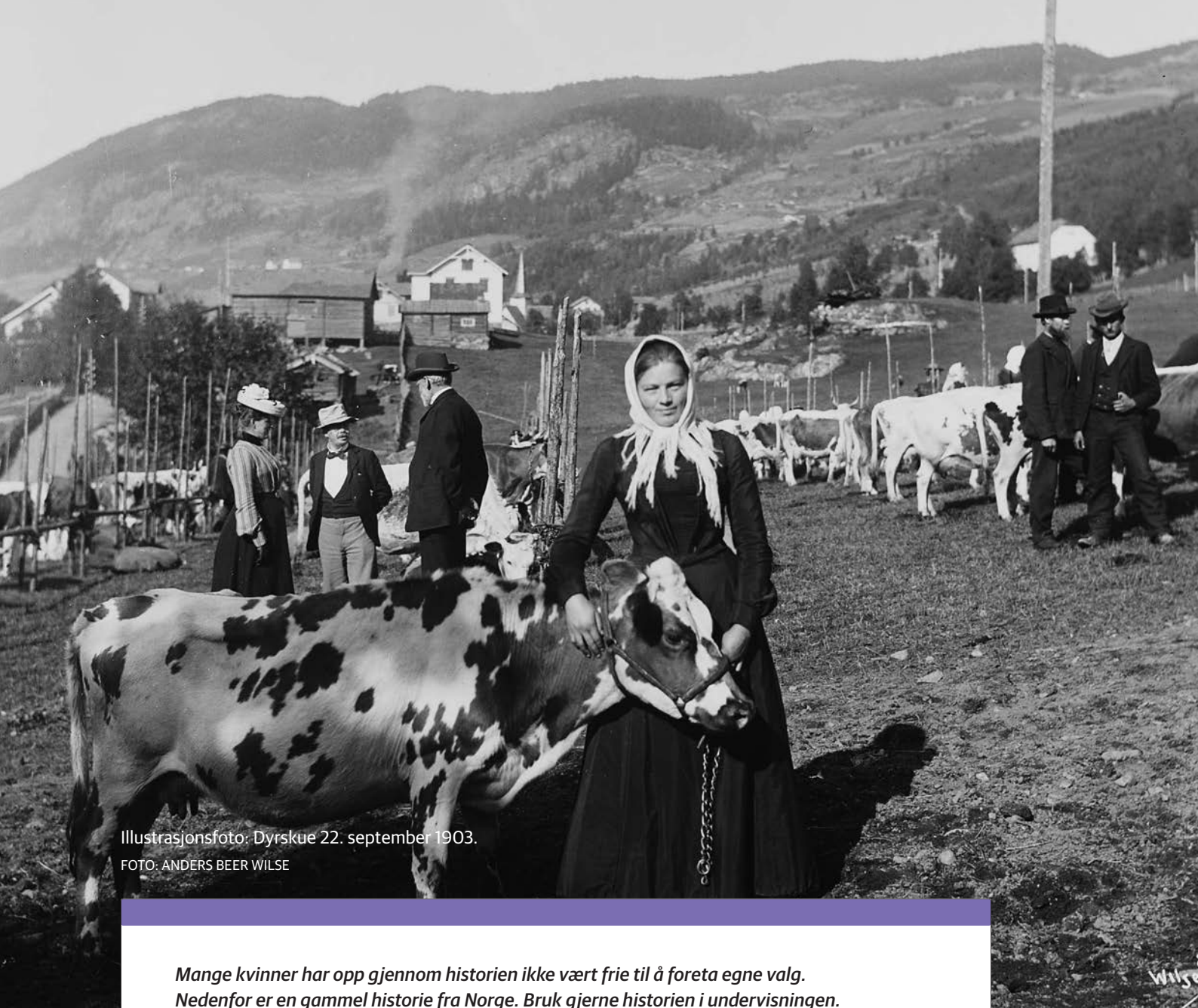
Illustrasjonsfoto: Dyrskue 22. september 1903.