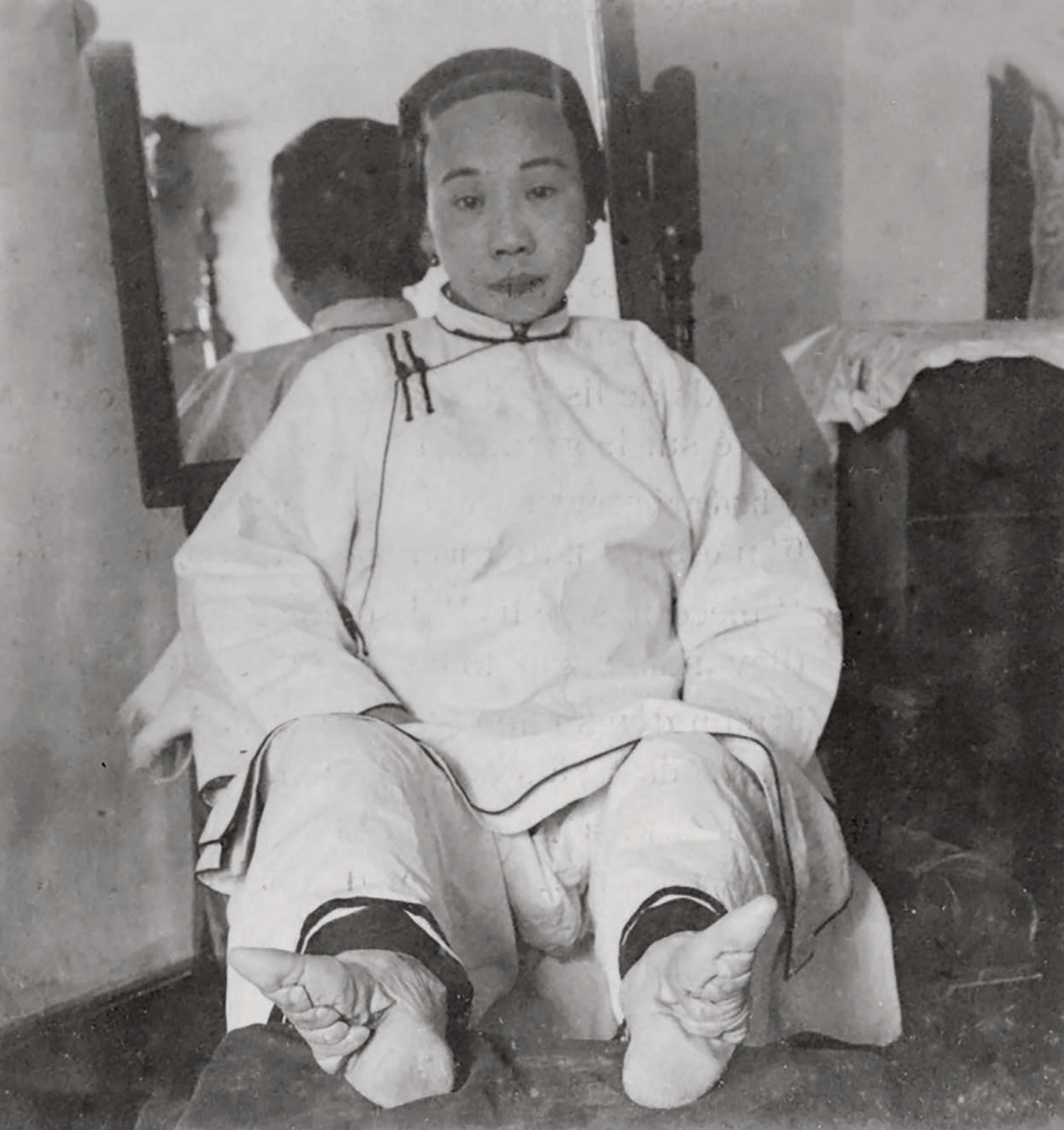
Snøring av føtter var en skikk som ble utført på jenter og kvinner i Kina i omtrent 1000 år, fra begynnelsen av 900-tallet til tidlig på 1900-tallet.