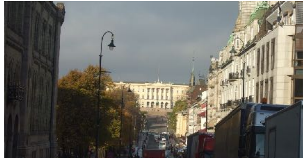
Hvor ytringsfrihetens grenser skal gå, er et mye debattert spørsmål i Norge.

Hjorth L, Djuliman E (2007) Bygg broer ikke murer - 97 øvelser i menneskerettigheter, flerkulturell forståelse og konflikthåndtering , Humanist forlag